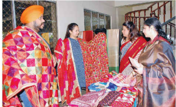
கோவை சுகுணா திருமண மண்டபத்தில் நடைபெறும் கைவினைப் பொருள்கள் கண்காட்சியில் ஆடைகளைத் தேர்வு செய்யும் வாடிக்கையாளர்கள்.

கோவை, ஜூலை 18: கிராஃப்ட் கவுன்சில் ஆஃப் தமிழ்நாடு சார்பில் கோவையில் கிராஃப்ட் பஜார் 2024 என்ற பெயரில் கைவினைப் பொருள்கள் கண்காட்சி, விற்பனை தொடங்கியுள்ளது.