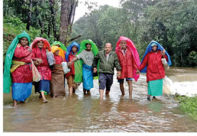
அணலி எஸ்டேட் செல்லும் சாலையில் தரைபாலத்தை மூழ்கடித்தபடி செல்லும் வெள்ளநீரில் செல்ல முடியாமல் தவிக்கும் எஸ்டேட் தொழிலாளர்கள். (வலது) வால்பாறை அக்காமலை தடுப்பணியில் வழிநடேகும் நீர்.