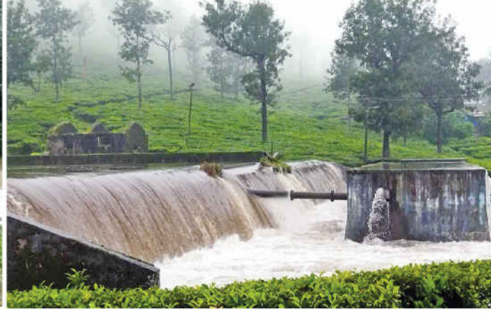
அணலி எஸ்டேட் செல்லும் சாலையில் தரைபாலத்தை மூழ்கடித்தபடி செல்லும் வெள்ளநீரில் செல்ல முடியாமல் தவிக்கும் எஸ்டேட் தொழிலாளர்கள். (வலது) வால்பாறை அக்காமலை தடுப்பணியில் வழிநடேகும் நீர்.

வால்பாறை, ஜூலை 18: வால்பாறையில் தொடரும் கனமழையால் பொதுமக்களின் இயல்பு வாழ்க்கை பாதிக்கப்பட்டுள்ளது. பல இடங்களில் மரங்கள் முறிந்து விழுந்துள்ளதால் போக்குவரத்து பாதிக்கப்பட்டுள்ளது.